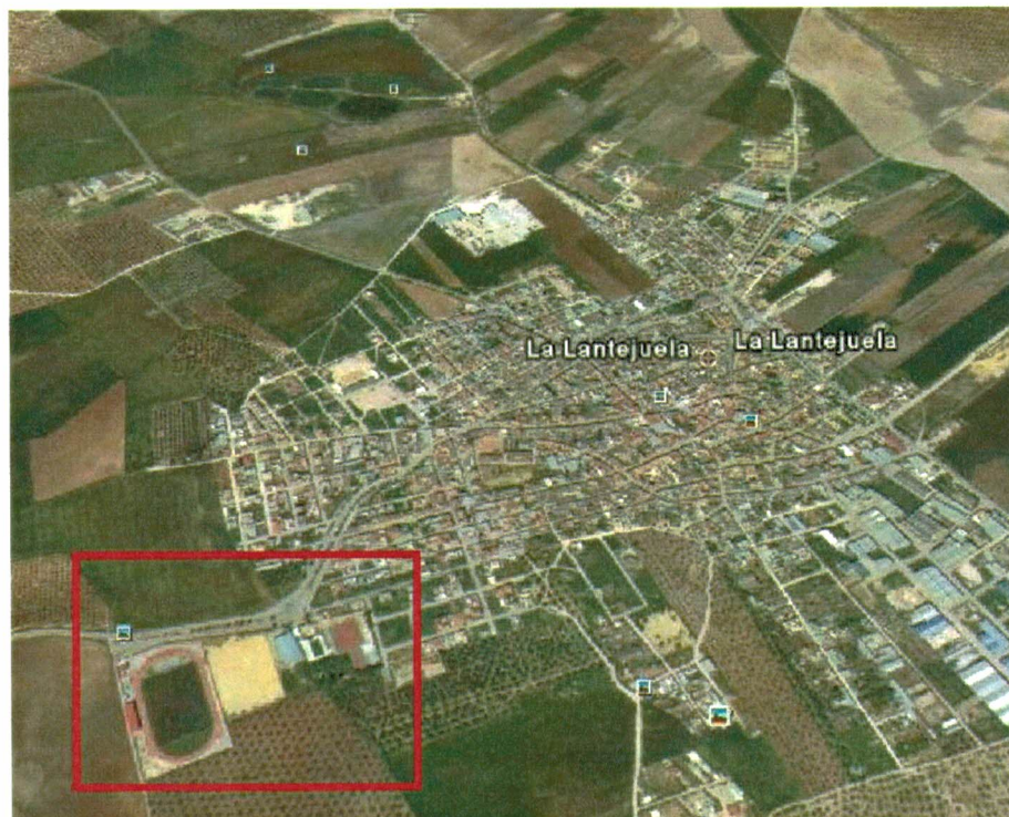
Imagen general de Lantejuela. En primer plano el Polideportivo Municipal.

A continuación lo situamos en la fotografía aérea del municipio: