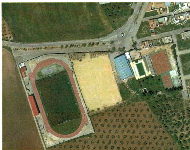
Detalle del Polideportivo Municipal.