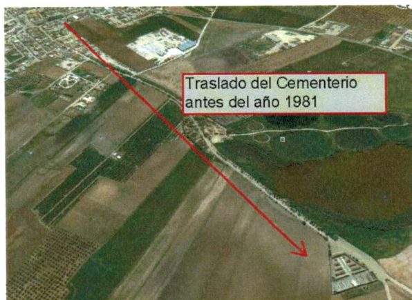
En primer plano el actual Cementerio. Al fondo el núcleo urbano.